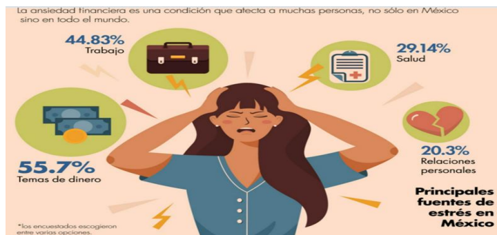
Figura 2.- Stress nacional. Ver [16]

Por lo que se hace necesario continuar aprendiendo de esta visión transdisciplinaria y así continuar formando nuevos investigadores que cumplan con los rasgos característicos de esta perspectiva y no solo a investigadores sino también a instituciones, así como gobiernos y la sociedad civil en general.