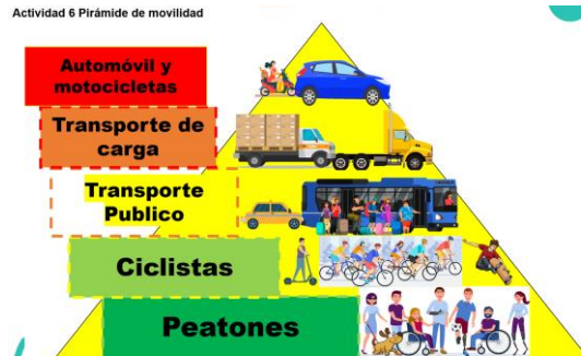
Figura 5. Pirámide de movilidad

banqueta porque sus familiares y más conductores lo hacían por diferentes motivos. De igual manera el que las bicicletas puedan circular arriba de la banqueta, cuando deben de ir pegadas a la acera.