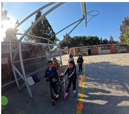
Figura 6. Actividad práctica de Educación vial

En la pirámide de movilidad en la primera evaluación ninguno de los niños conocía dicha pirámide por lo cual no acertaron correctamente. En la segunda evaluación solo 42 de los 552 alumnos respondieron correctamente la pirámide de movilidad en su totalidad. Los niños que respondieron correctamente era de 5 y sexto grado. Un dato importante es que 342 niños acertaron correctamente que el peatón es el que tiene mayor prioridad en la pirámide. En la primera evaluación solo fueron 81.