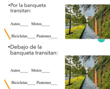
Figura 4. Actividad llamada "por la banqueta"

La siguiente actividad a resaltar fue sobre mencionar que medios de transporte pueden ir arriba o debajo de la banqueta.