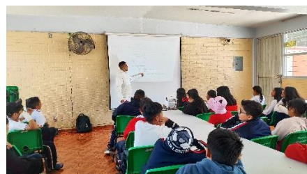
Figura 3. Segunda evaluación de educación vial