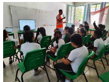
Figura 2. Primera evaluación de educación vial

En la primera evaluación fueron 564 alumnos y en la segunda 552 alumnos.