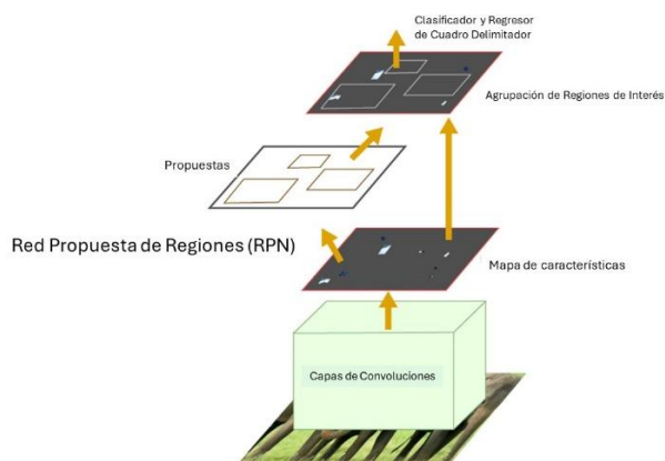
Figura 1. Arquitectura Faster R-CNN.

En la figura 1 se puede observar la arquitectura Faster R-CNN, la cual consta de dos componentes: La Red de Propuestas Regionales (RPN) y el Detector rápido de R-CNN.