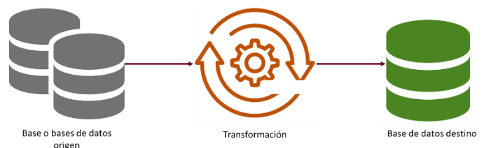
Figura 1. Proceso ETL. Elaboración propia, 2025.

El proceso ETL se detalla a continuación[5]: