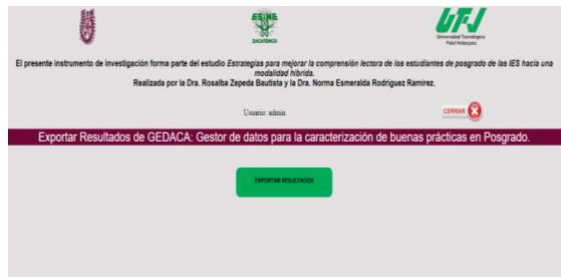
Figura 8. Portal del Administrador [8]

Para acceder a los datos es necesario ingresar al portal del administrador ya que es éste es el único que tiene los permisos para descargar los resultados recabados en un formato de Excel (Figura 8).