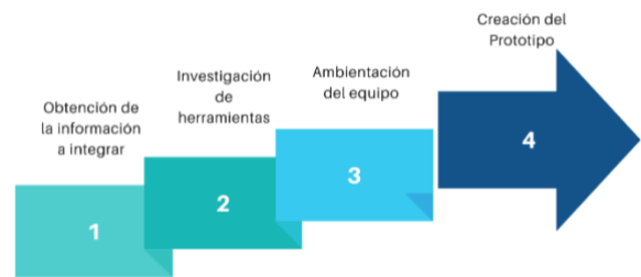
Figura 2. Actividades del primer sprint [5].

Para el primer sprint se planificaron las siguientes actividades (Figura 2).