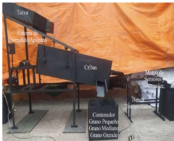
Figura 3 Prototipo clasificador de granos de maíz por tamaño y color.

Al terminar esta acción el usuario termina el proceso de clasificación y puede continuar con el envasado del grano.