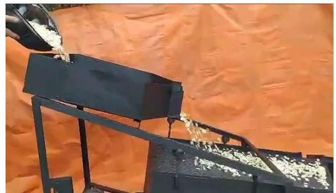
Figura 2 Proceso de alimentación del clasificador de granos de maíz por tamaño y color

El proceso de clasificación de granos de maíz por tamaño y color inicia cuando el usuario activa el sistema de control de encendido/apagado, el cual cuenta con un sistema de protección electromagnética para evitar daños a cualquiera de los elementos eléctricos en caso de existir una descarga eléctrica o un mal uso por parte de usuario. A partir de este momento usuario observa el movimiento del sistema de cribado y la banda transportadora. El siguiente paso a seguir por parte del usuario es alimentar al prototipo. Esto lo realizara dejando caer granos de maíz sobre la tolva (Figura 2). La cual tiene una capacidad de 48000 cm 3 o 24.15 kg de granos de maíz, cuenta con un elemento mecánico que le permite regular el caudal de los granos hacia las cribas. Este mecanismo consiste de un perno de acero, el cual le permite al usuario regular el flujo de granos; entre el 25%, 50% o 75% del caudal.